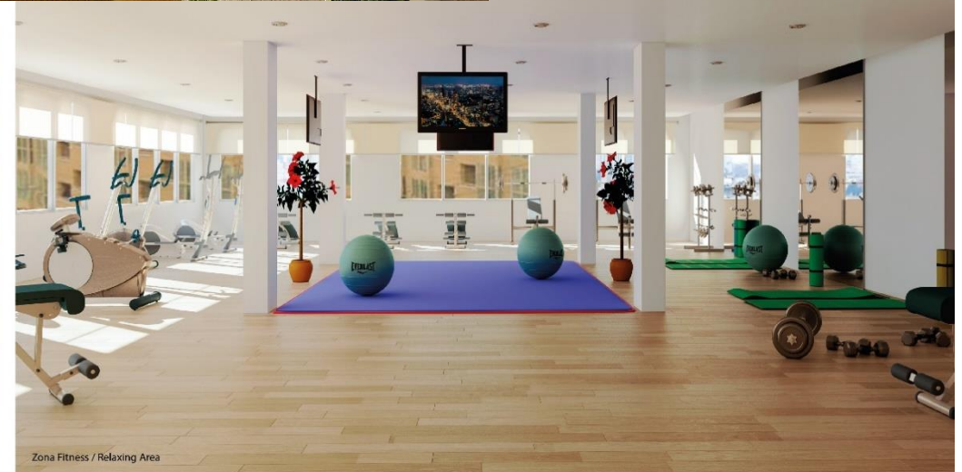
Zona Fitness / Relaxing Area