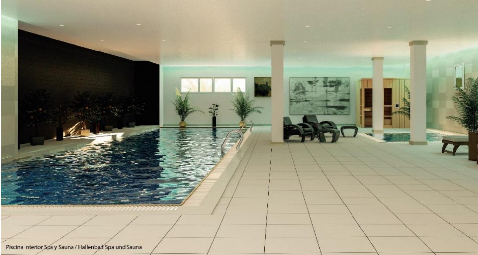
Piscina Interior Spa y Sauna / Hallenbad Spa und Sauna